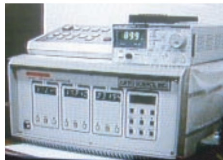
・3軸自動調芯コントローラ