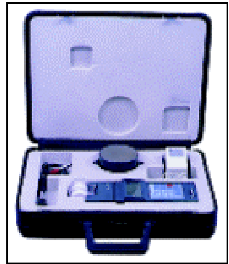
キャリングケース(付属品)