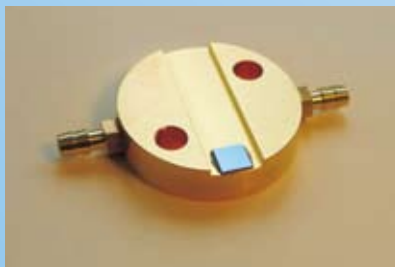
soldered chip on water cooled mount with 25.0mm diameter