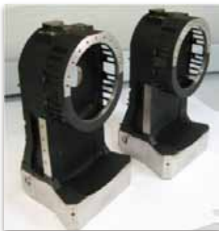
光学機器への成膜