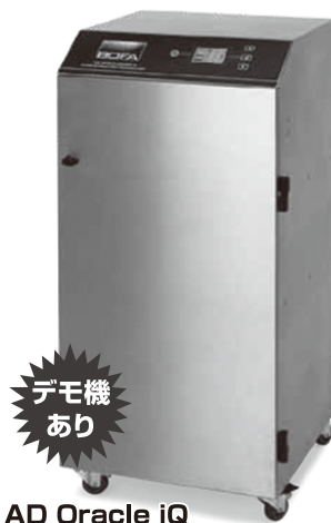
AD Oracle iQ